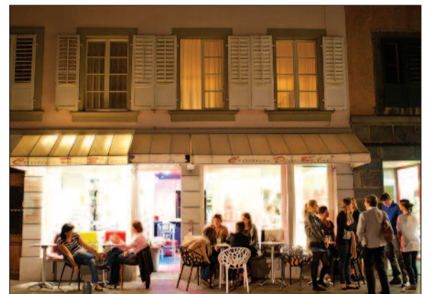
ARCH - M. ROUILLER